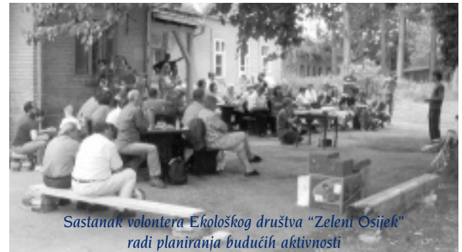
Sastanak volontera Ekološkog društva "Zeleni Osijek" radi planiranja budućih aktivnosti